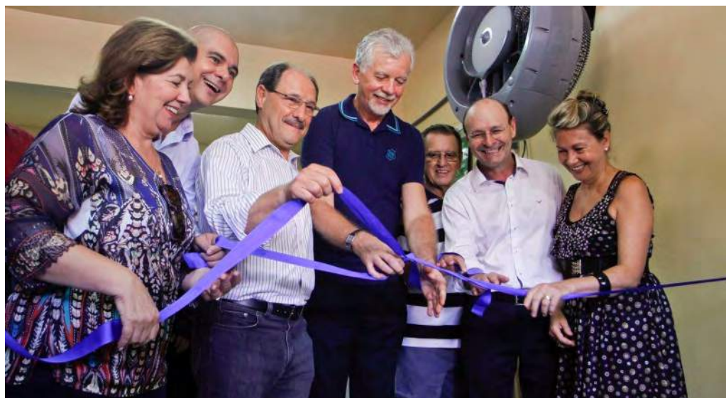
Imagem 2: cerimônia de abertura do Restaurante Popular.

Eram posicionamentos distintos que estavam em jogo: vestindo a camiseta do MNPR e legitimando “a visão governamental” sobre o papel inquestionável de suas ações rumo à superação da “pobreza e desigualdade”, aquele sujeito fazia com que, na visão de militantes e apoiadores, o movimento fosse alvo de uma estratégia política que colocava seus integrantes publicamente ao lado das autoridades governamentais, numa posição indesejada, na medida em que ocultava o peso de suas mobilizações na reinauguração do restaurante. Tanto é que, nas falas públicas que compuseram o ritual de inauguração, os militantes do MNPR não tiveram nenhum espaço para se colocar.