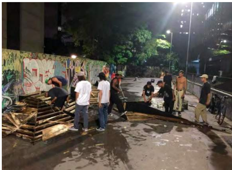
Imagem 1: Skatistas ajustam obstáculos no Beco do Valadão (Disponível em: https://www.instagram.com/becodovaladao )

ao ramo, os quais vêm conseguindo, por vias legais, a autorização para estacionar food trucks e comercializar seus respectivos produtos no local.