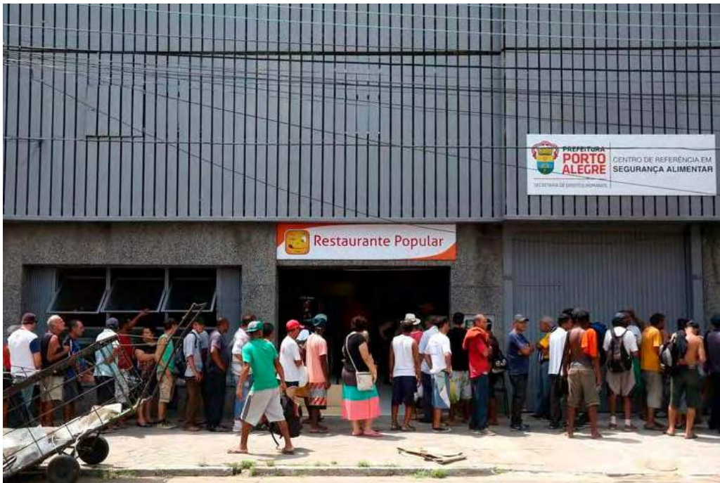
Imagem 1: Entrada do restaurante popular.

o evento e que passaram a entrevistar o até então desconhecido “militante”. Entre as perguntas que eram realizadas pelos profissionais de imprensa, identifiquei uma linha especulativa comum: a transformação que a reabertura do restaurante popular provocaria na vida das pessoas “em situação de rua”. Com uma voz mansa e quase inaudível, aquele homem, cercado de gravadores, câmeras e microfones, humildemente explicou que, a partir daquele dia, ele teria um lugar onde poderia se alimentar, sem gastar muito e sem precisar “pedir comida nas ruas”. Ao mesmo tempo, era possível ouvir o Secretário de Direitos Humanos afirmar, para outros repórteres, que a abertura do restaurante representava um importante passo rumo à construção da dignidade das camadas mais pobres da população, simbolizando a luta contra uma sociedade injusta e desigual.