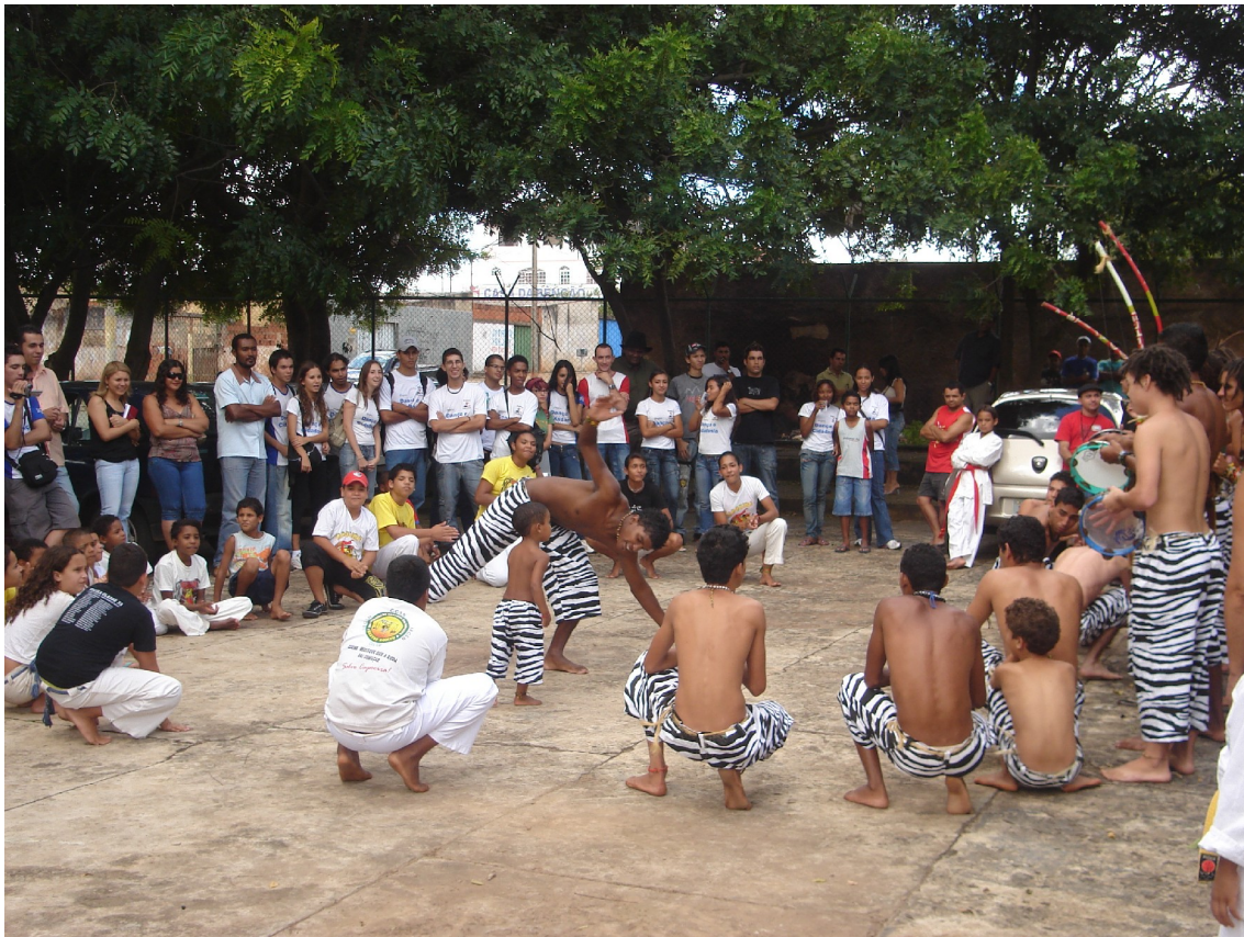
Grupo de capoeira no intervalo do evento

Logo, os grupos pararam, era hora do lanche. Lá dentro, no salão, quem ia comer assistia a apresentação de um grupo de forró. Após o lanche, metade das pessoas já havia indo embora, inclusive toda a primeira banca de políticos. Luana chamou todos que ainda estavam lá para ouvirem a nova banca de políticos que ela convocava no microfone. Entre eles, o deputado Geraldo Magela e o deputado Ulisses. Mais uma vez, cada deputado falando sobre o trabalho que desenvolvem na câmara, mas nenhum arriscando palpites ou falas diretas relacionadas com a realidade local.