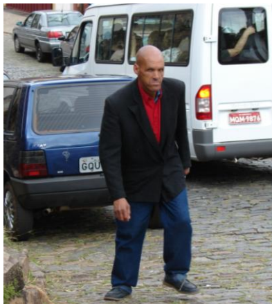
Angu na semana santa – Por Chiquinho de Assis