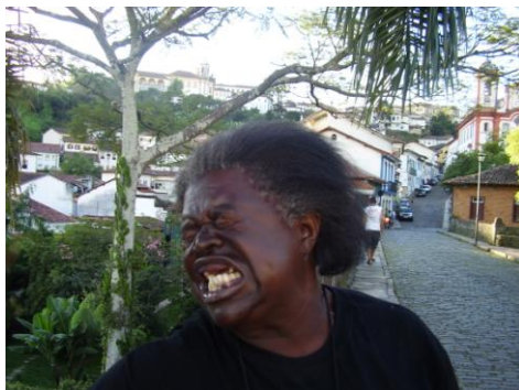
Acara de quem mexe com Ninica quando morre - Bairro Antônio Dias.