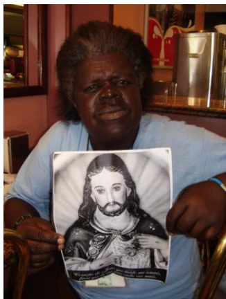
Ninica e a imagem de Nosso Senhor - Padaria Pan Art.