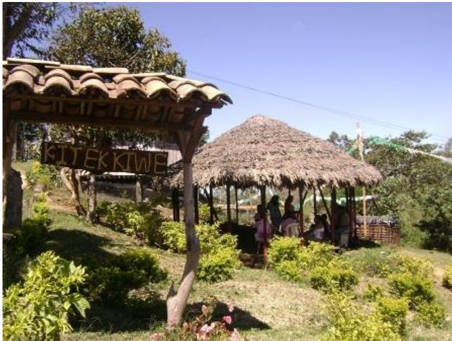
Encuentro semanal de autoridades del Cabildo Kitek Kiwe. Septiembre de 2013.