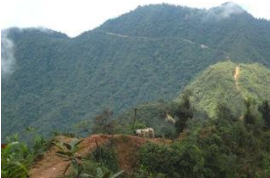
Camino al Naya.