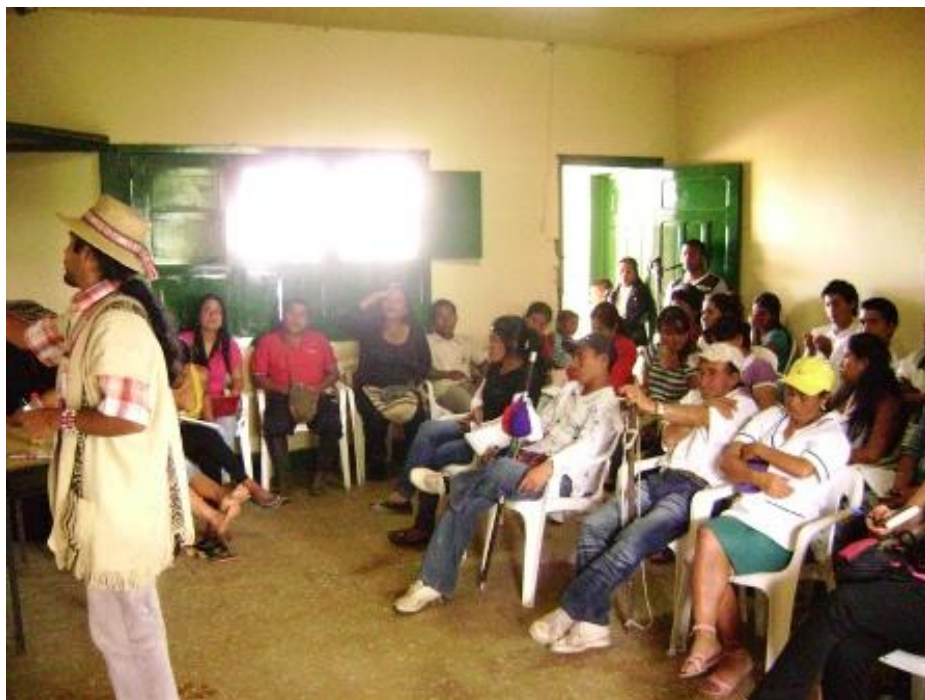
The' Whala de visita en La Laguna dicta conferencia sobre cosmovisión Nasa a los cabildantes de Kitek Kiwe. Junio de 2011.