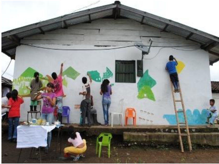
Actividades lúdicas con estudiantes del Centro Educativo Elias Trochez en el marco del Plan de Vida. Diciembre de 2011.