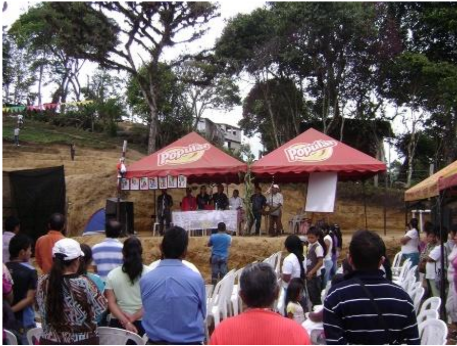
Apertura Ceremonias al Sol con presencia de autoridades locales del municipio de Timbío. Junio de 2011.