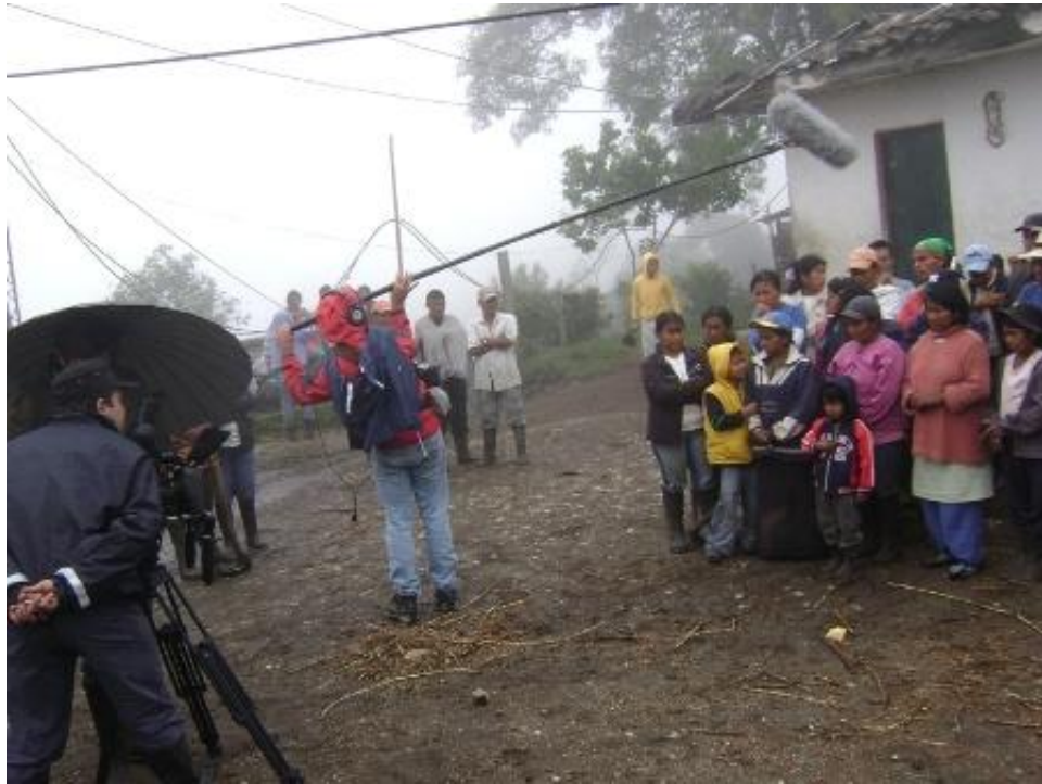
Cabildo Kitek Kiwe narra los hechos de la masacre para programa de televisión suiza.