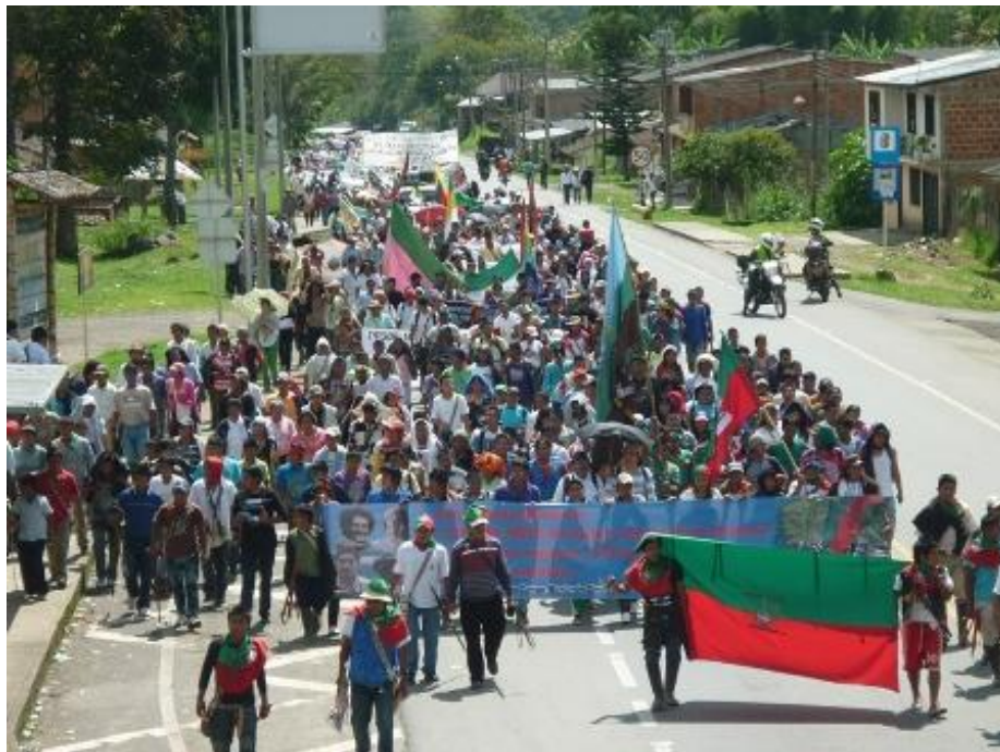
Minga de resistencia social Indígena camino a Bogotá. Noviembre, 2008.