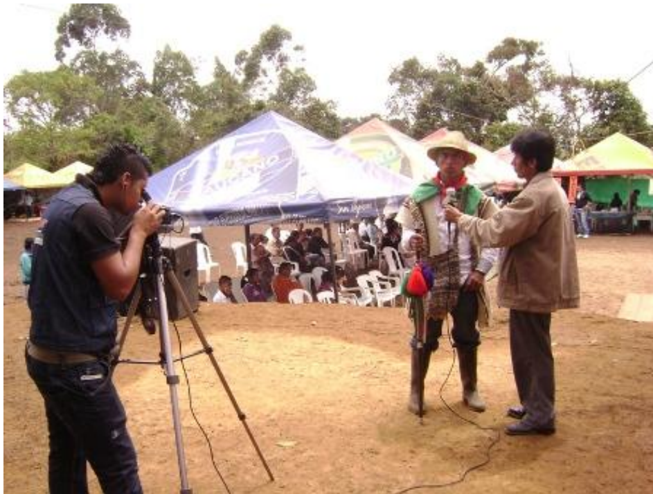
Gobernador del Cabildo (2011) explica significado de las Ceremonias al Sol a canal de televisión local. Junio de 2011.