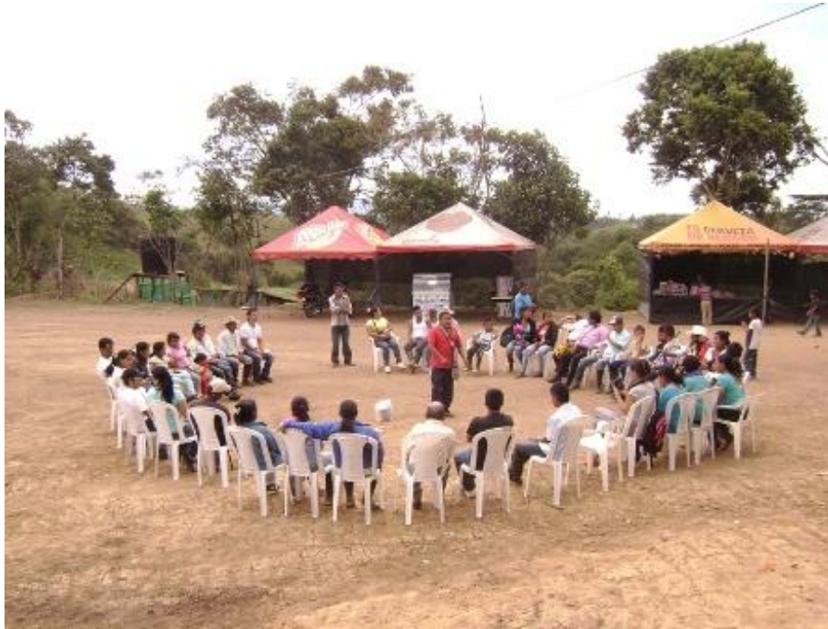
The' Whala de visita en La Laguna realiza ritual de armonización. Junio de 2011.