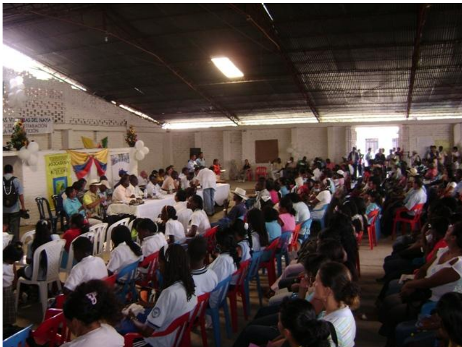
Acto conmemorativo de la masacre del Naya. Timba Cauca. Abril de 2008.