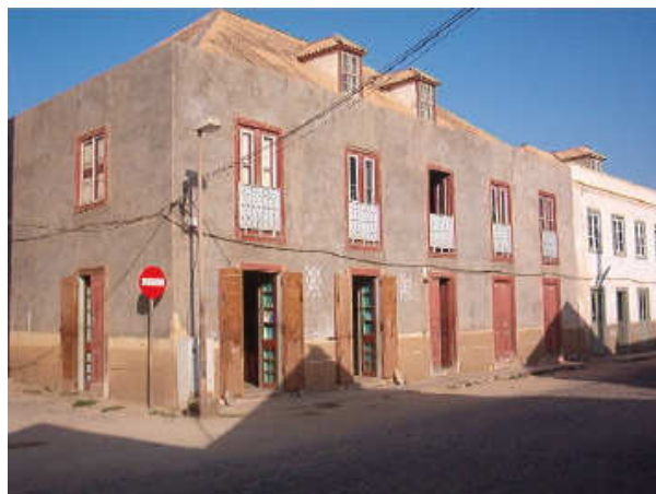
Casa em que viveu David Ben'Oliel

Paralelamente a estas poucas famílias influentes vivia a grande maioria do povo da Boa Vista que desempenhava atividades de pequeno comércio, pesca, agricultura de subsistência, ou então eram simplesmente escravos. Sem dúvida, o cidadão médio era pobre e sem muitos bens pessoais (Kasper, 1987: 63).