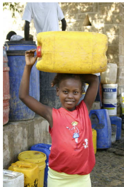
Crianças fazendo “mandados”

Por volta dos 12 anos, começa a haver uma diferenciação entre afazeres de moças e rapazes, cabendo a estas os cuidados com os mais novos, alimentação e higiene da casa. O que resta a eles são afazeres da rua, ou seja, desde muito cedo os rapazes são liberados da esfera da casa. Os jovens só se vêem livres dos mandados quando começam alguma atividade geradora de renda para si e para a família. Pelo que pude perceber, essa ajuda pode variar desde as responsabilidades nos afazeres domésticos até contribuições em dinheiro para as necessidades da casa.