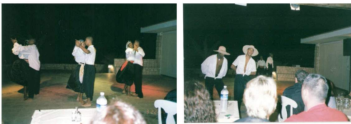
Apresentação de noite cabo-verdiana no Hotel Marine Club

valorizar o corpo. Quando a conheci trabalhava no Hotel Marine Club como animadora e, mesmo nas horas de folga, a encontrava acompanhada por um ou mais italianos e italianas. A moça falava a língua com fluência e fazia bom uso de todos os seus atributos para conquistar a simpatia e “amizade” dos visitantes. Apesar de reclamar algumas vezes dos “brancos” (chamava-os de fastentos – chatos - com freqüência) que estavam sempre a demandar sua companhia, me elencava as inúmeras vantagens do trabalho como animadora no hotel: as gorjetas, a convivência com pessoas diferentes, a possibilidade de sair da Boa Vista, os presentes que ganhava e a vida movimentada caracterizada pelo fato de não ter tempo para outras coisas, por viver cansada e correndo entre casa, hotel e atividades com turistas. Além do trabalho no hotel era sempre convidada a participar das noites cabo-verdianas para desfilar trajés típicos da África, apresentar as danças tradicionais e, por fim, ensinar os turistas alguns estilos de danças.