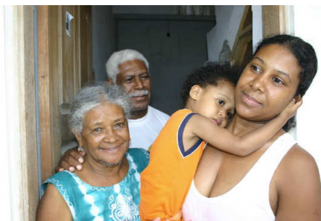
Avó, avô, filha e neta.

O homem também muda de fases ao longo de seu ciclo de vida, enquanto homem jovem ele parece estar vinculado mais ao seu grupo consanguíneo do que à nova família que constitui de forma processual ao lado de sua (ou suas) mãe-de-filho . Quando maduro, em geral passa a ocupar uma posição mais estável na casa e isso é ritualizado pela formalização do casamento. Apesar disso, na esfera das decisões cotidianas e da administração da casa, ele não sai de uma posição periférica relativa ao mundo doméstico ao longo de toda a vida. Nesse sentido, diferentemente do pai, o avô é figura presente, é fonte de autoridade e, geralmente, é chamado de papá . Enquanto homem, não tem que estar fisicamente ligado à criança em seu dia a dia.