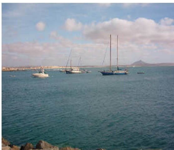
Deserto de Viana e Praia de Chaves

Dada sua proximidade com a ilha do Sal (apenas 15 minutos de avião) não tardou muito para Boa Vista ser conhecida pelos turistas e, conseqüentemente, por investidores. A ilha atrai por ter um potencial maior que