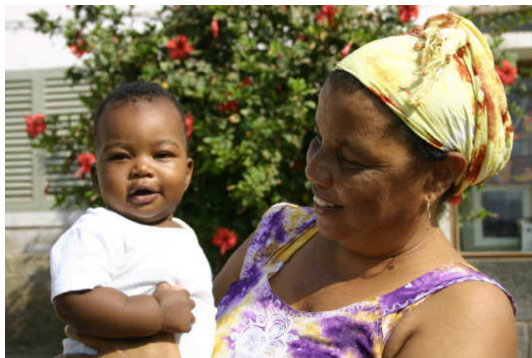
Avó materna e neto

Por sua vez, as filhas esperam a ajuda da mãe e das outras mulheres da família com seus filhos. É preciso ficar claro que esse não é um fator de angústia ou debate, é simplesmente assim que as coisas acontecem e devem acontecer. Em situações cotidianas, cuidar de um neto ou deixar que a sua mãe cuide de seu filho não necessita de negociação entre as duas mulheres, é um dado. É quando este comportamento esperado é quebrado por motivos diversos, que se abre uma esfera de negociação, rumores e conflitos que irão mobilizar a família e até a comunidade como um todo.