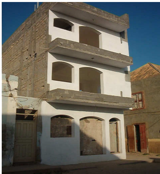
Casa de Emigrante