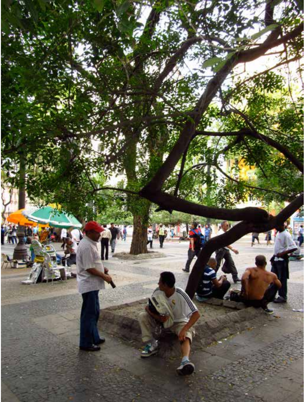
Figura 4: Vista nordeste da praça a partir de seu setor retangular sombreado, outubro de 2013