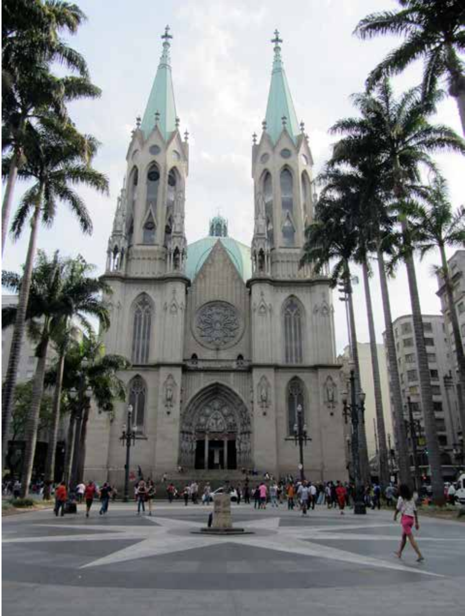
Figura 2: Vista sul da praça a partir do segmento entre a estátua de Paulo e o Marco Zero, outubro de 2013

De fato privilegiei fisicamente, nos mais de 30 mil metros quadrados da atual Praça da Sé, três setores. Enfoquei o tablado retangular pontilhado de palmeiras imperiais que se estende para nordeste a partir da escadaria da catedral (figuras 2 e 3):