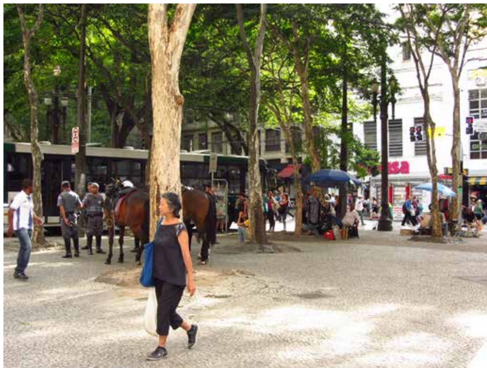
Figura 5: Vista sudoeste da praça a partir de seu setor triangular, outubro de 2013

Enfim, centrei-me num triângulo também cimentado e sombreado, no extremo norte da praça (figura 5):