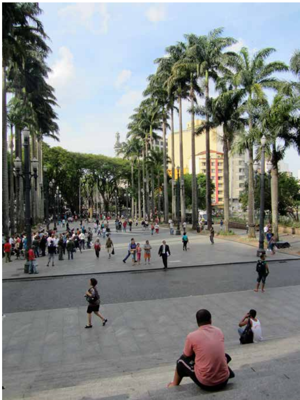
Figura 3: Vista nordeste da praça a partir da escadaria da catedral, outubro de 2013

Ademais, etnografei outro retângulo cimentado mais a nordeste ainda, com árvores de sombra (figura 4):