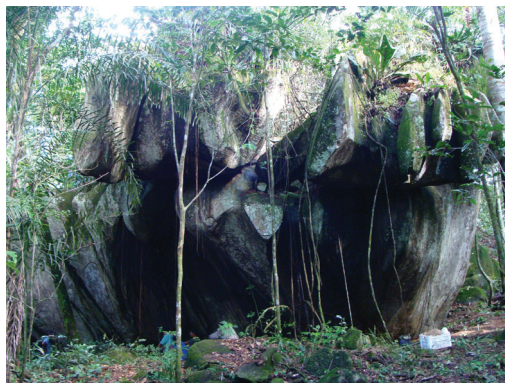
Figura 7 - Abrigo rochoso com cerâmica Aristé

Como no caso das estruturas megalíticas, também esses lugares naturais atestam uma prolongada relação com os grupos indígenas que os utilizavam, indicando que as práticas de visitas e revisitas perduraram por um longo período e por uma extensa área. Dada a semelhança entre a composição dos objetos presentes, seus conteúdos e sua forma de manipulação, as cavernas são verdadeiros “megalitos naturais”. Não são monumentos, no sentido estrito do termo, mas sim lugares na paisagem monumentalizados pela prática. Apesar das claras diferenças estruturais entre os dois tipos de sítios (um presente na natureza, outro construído), o que observamos é a repetição de performances, resultando em registros arqueológicos bastante similares, o que reforça uma complementaridade entre esferas que – dentro do pensamento moderno ocidental – são consideradas opostas: natureza e cultura.