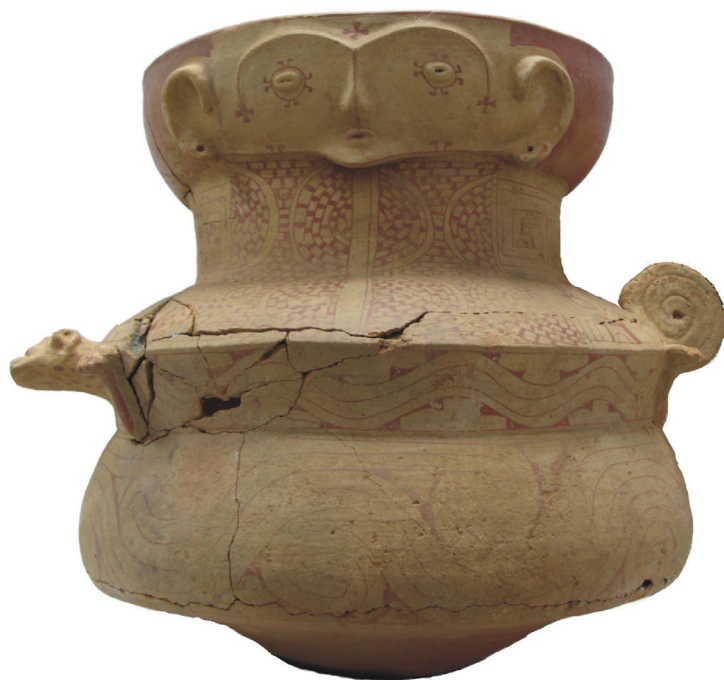
Figura 2 - Cerâmica antropomorfa típica do estilo EnferPolychrome

O tamanho pequeno dos sítios de aldeias e sua relativa invisibilidade no registro arqueológico já haviam sido notados por Meggers e Evans em 1957. De fato, as aldeias desse período nunca excedem 10.000 metros quadrados, possuindo estruturas muito simples, como concentrações de buracos de poste, pequenas fogueiras e lixeiras, o que indica uma curta permanência em cada lugar.