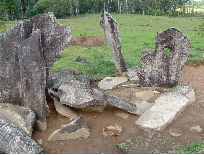
Figura 3 - Sítio megalítico do período EnferPolychrome

de blocos de granito em posições horizontal, vertical ou inclinada, dispostos no topo de colinas. Os tamanhos e as composições são variáveis. Algumas estruturas são pequenas, com menos de 10 metros de diâmetro, formadas por blocos medindo menos de um metro. Outras podem medir mais de 30 metros, sendo compostas por blocos de até 4 metros de altura.