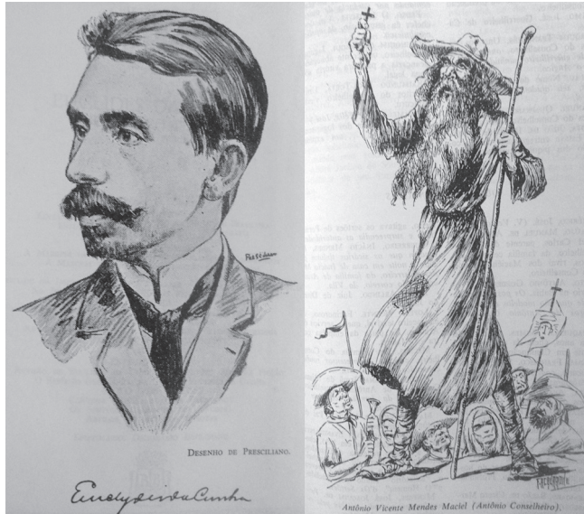
Figuras 6 e 7: Euclides da Cunha e Antônio Conselheiro

Euclides era “o grande homem pelo direito”, o herói nacional da República, isto é, da civilização.