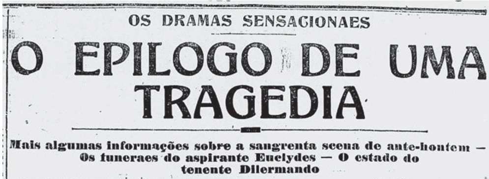
Figura 4: Gazeta de Notícias , 6 de julho de 1916