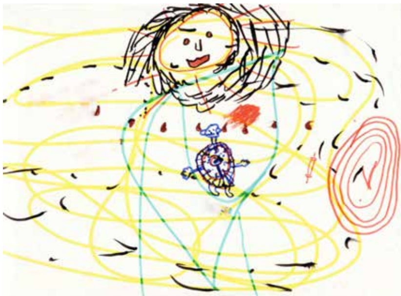
Figura 5 “Origem da doença mental”