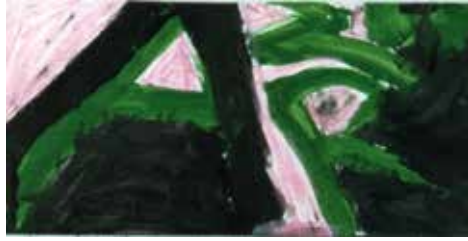
Figura 1 Criação iconográfica de uma frequentadora do ATE

Contudo, seria uma utopia dizer que mesmo uma arte bruta, segundo sua histórica conceitualização, estaria livre das normas do campo artístico, como nos aponta Bourdieu (1996), em especial em sua análise sobre a arte bruta, onde afirma que os teóricos não podem constituir as produções artísticas dos esquizofrênicos em uma espécie de senso absoluto. Compartilhamos com a perspectiva deste autor, no sentido de que nossa referência não foi buscar uma norma estilística, ou classificar as produções de nossos interlocutores do ATE em uma corrente da história da arte. Não podemos ignorar, retomando as reflexões dele, que qualquer classificação segue um consenso hegemônico, uma doxa , uma crença compartilhada que vai estruturar um campo determinado e estabelecer relações de poder.