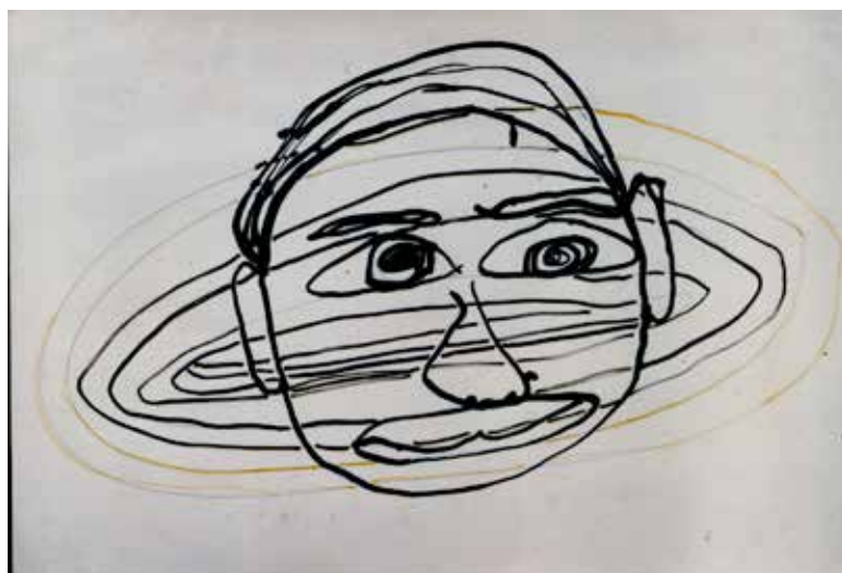
Figura 4 “O doente mental”