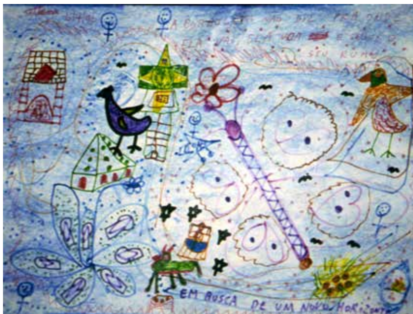
Figura 3 “Meu tempo de criança”

Nos anos que se passaram de nossa interação com Pedro no ATE, imagens e narrativas verbais figuravam uma sucessão de recordações de sua biografia infantil. Sobretudo nas iconografias associadas ao discurso verbal, observa-se a presentificação de um tempo biográfico que o interlocutor resgatava a cada momento de nossa interação com ele. Temas da memória infantil, bem como outros temas de suas experiências biográficas, ganhavam lugar nas suas expressões visuais e narrativas verbais. Essas temáticas falavam de suas vivências em instituições psiquiátricas e de suas representações acerca de temas de saúde-doença mental, como observamos na continuidade.