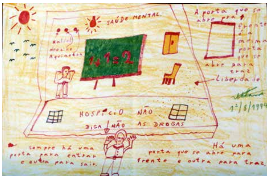
Figura 7 “O manicômio”